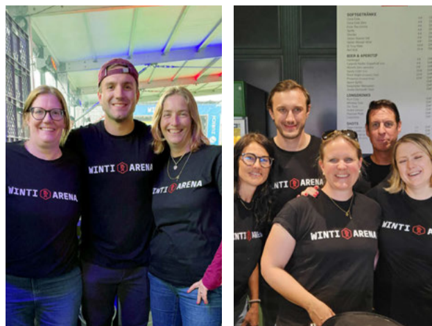
Grossartige Helfercrew in der Winti-Arena.

Als Dankeschön wurde ein Grillabend organisiert. kra