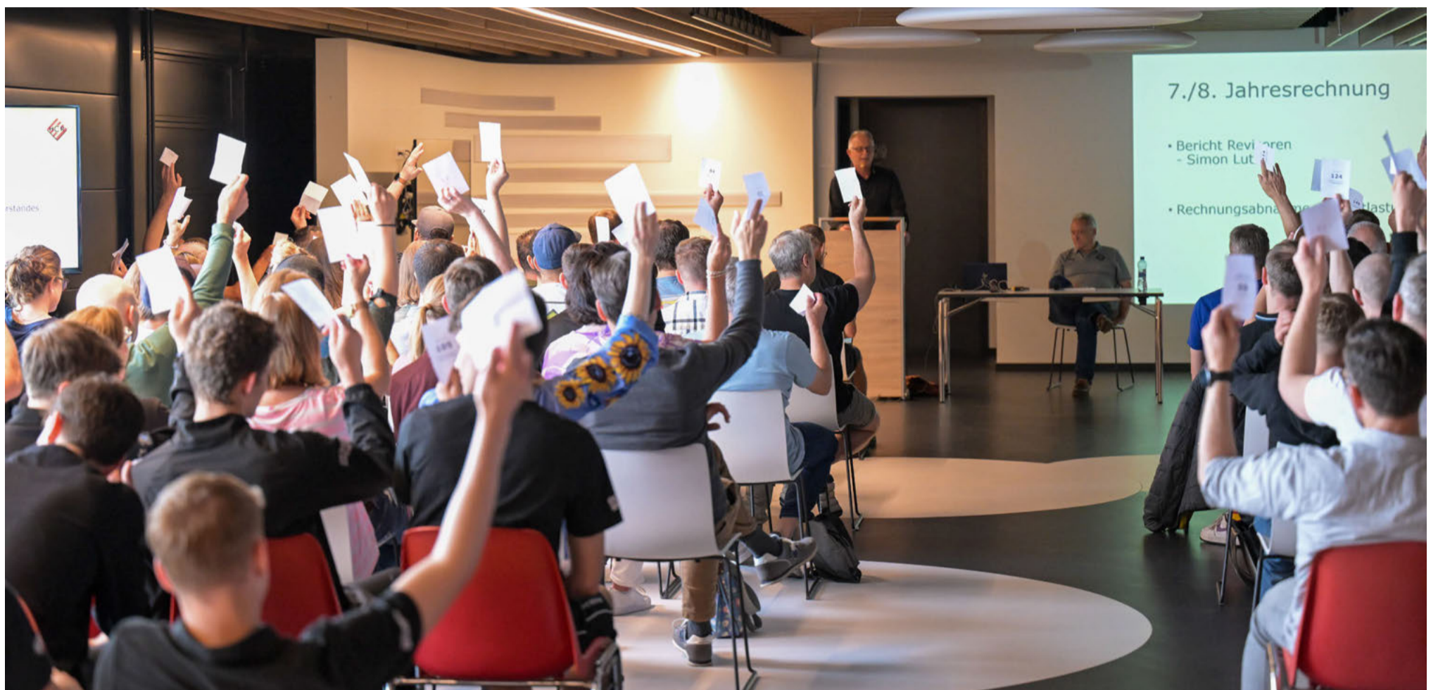
Der HC Rychenberg Winterthur steht finanziell auf gesunden Beinen und ist bereit die zukünftigen Herausforderungen anzupacken.