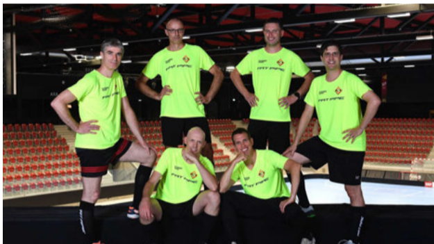
Motto HCR Plausch: An grossen Zielen wachsen.