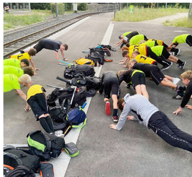
Die U14B: Ausdehnen wo auch immer Zeit und Platz ist.

Nach einem langen Turniertag in Basel musste sich unsere U14B-Junioren auf den Zug nach Hause sputen. Deshalb nutzt die Mannschaft den Bahnsteig und die vier Minuten Wartezeit auf das Tram zum Ausdehnen. Die möglicherweise fragenden Blicke von umstehenden Personen wurden nicht eingefangen, denn unsere Sportler konzentrierten sich auf das, was zu tun war.